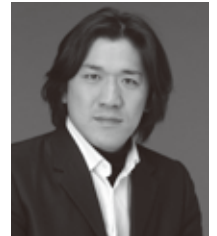
シモーネ 党 主税 Chikara To